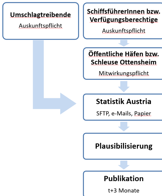
Abbildung 2: Güterverkehr – Ablauf der Datenübermittlung

Im Jahr 2019 übermittelten von den 14 Meldestellen zehn die Daten per E-Mail, eine Meldestelle nutzt bereits die neue Möglichkeit der Datenübermittlung per Schnittstelle. Der neue Datensatz wird dabei von zwei Meldestellen verwendet. Die restlichen drei Meldestellen übermitteln die Ergebnisse weiterhin mittels Papierformular.